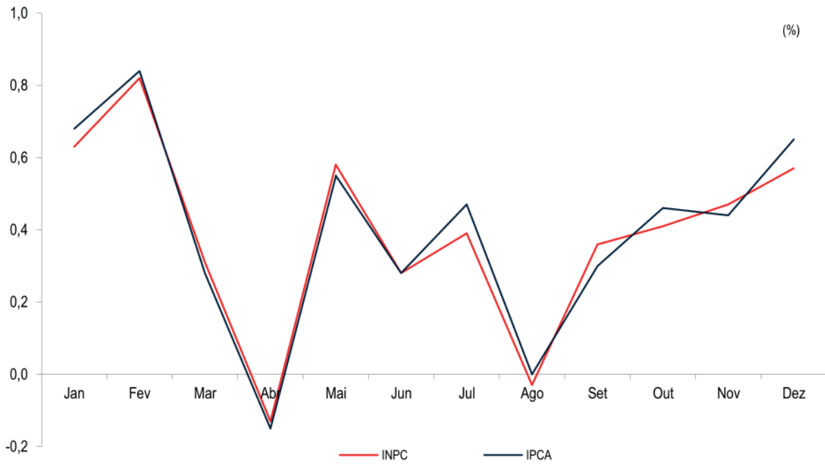
Gráfico 24.1 Variação mensal do INPC e IPCA da Região Metropolitana de Fortaleza - 2024