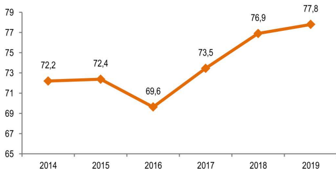
Gráfico 21.1 Taxa média mensal de ocupação nos meios de hospedagem de Fortaleza - Ceará - 2014-2019