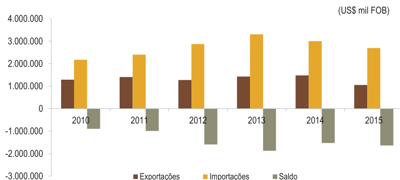
Gráfico 18.2 Balança comercial - Ceará - 2010-2015

Fonte: Ministério do Desenvolvimento, Indústria e Comércio Exterior (MDIC), Secretaria do Comércio Exterior (SECEX).