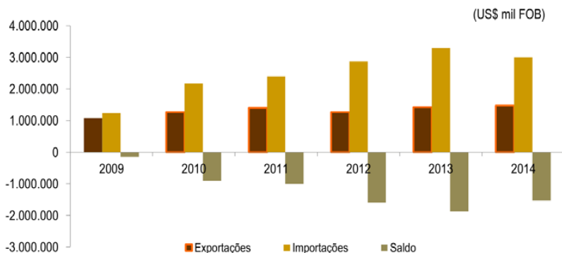
Gráfico 18.2 Balança comercial - Ceará - 2009-2014

Fonte: Ministério do Desenvolvimento, Indústria e Comércio Exterior (MDIC), Secretaria do Comércio Exterior (SECEX).