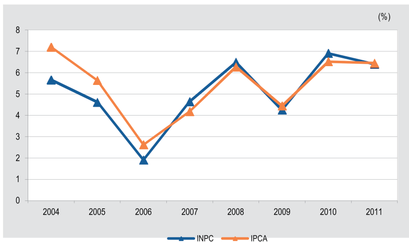
Gráfico 26.2 Variação acumulada do Índice Nacional de Preços ao Consumidor (INPC) e Índice de Preços ao Consumidor Amplo (IPCA) - Região Metropolitana de Fortaleza - Ceará - 2004-2011