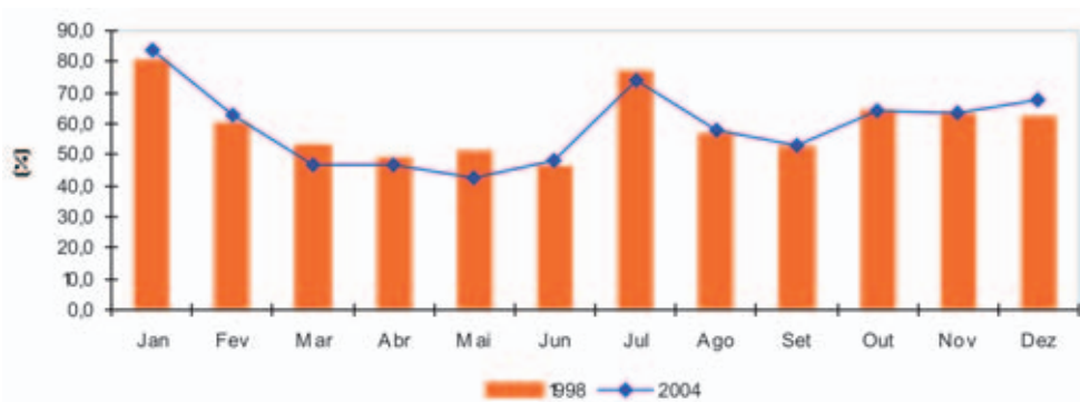
Gráfico 46 Taxa média mensal de ocupação nos meios de hospedagem - Ceará - 1998-2004