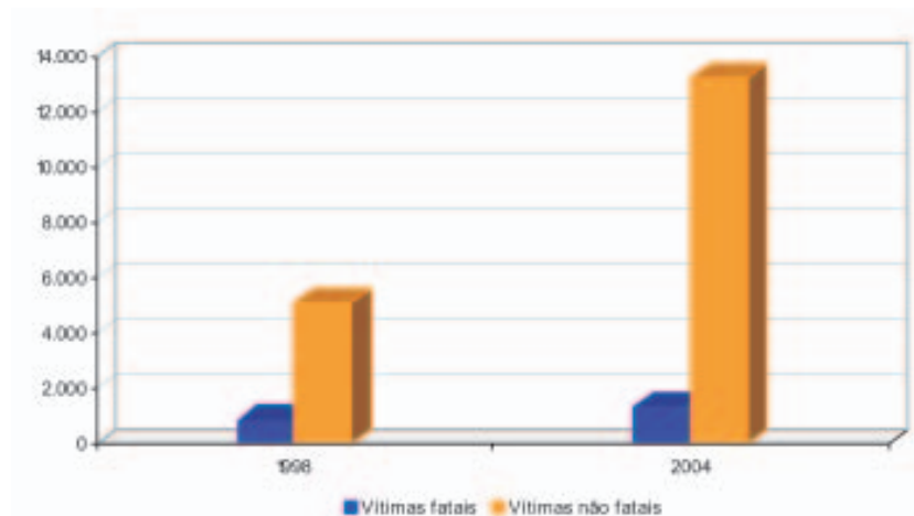
Gráfico 22 Vítimas em acidentes de trânsito - Ceará - 1998-2004

Fonte: Departamento Estadual de Trânsito (DETRAN-CE). (1) Inclusive as vítimas sem informação do sexo.