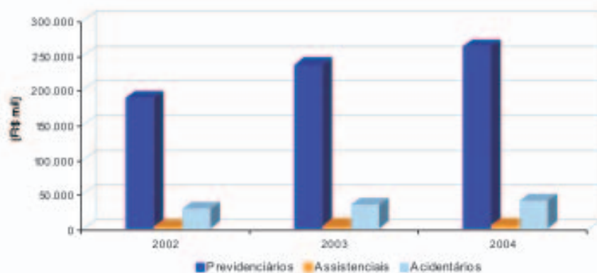
Gráfico 19 Valor dos benefícios ativos, segundo a espécie - 2002-2004

Fonte: INSS/Anuário Estatístico da Previdência Social 2004.